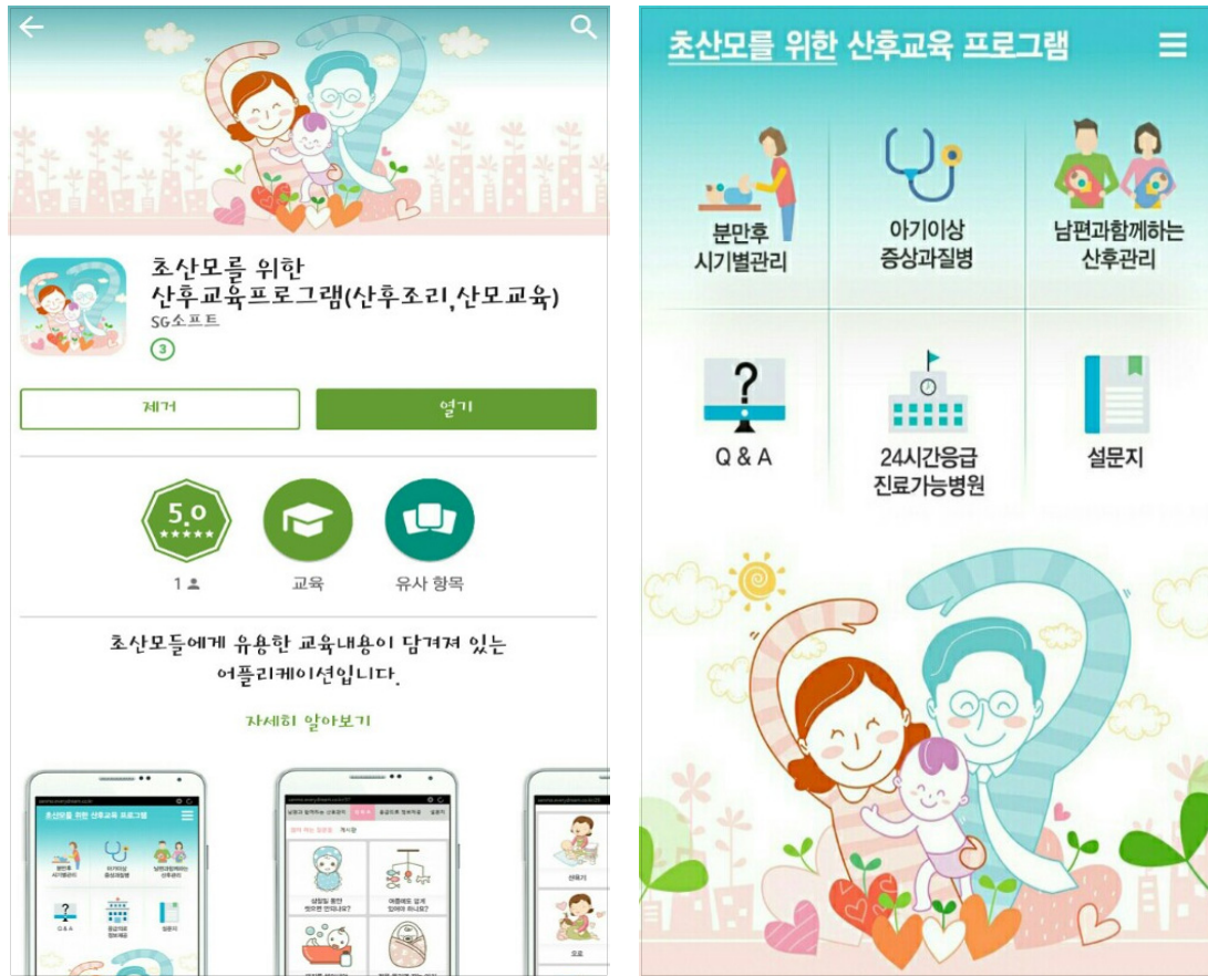
Figure 2. Example of mobile application screen.

산 1~2주”, “출산 2~3주”, “출산 3~4주”, “출산 4~5주”, “출산 6~7주”로 나누어 해당하는 주수에 필요할 것으로 사료되는 내용을 여성건강간호학 전공 교수와 논의하여 분류하였다. 각 주마다 교육내용은 3~6개로 하여 산모들이 부담없이 읽을 수 있도록 하였다.